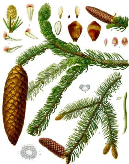
Obrázok č. 1